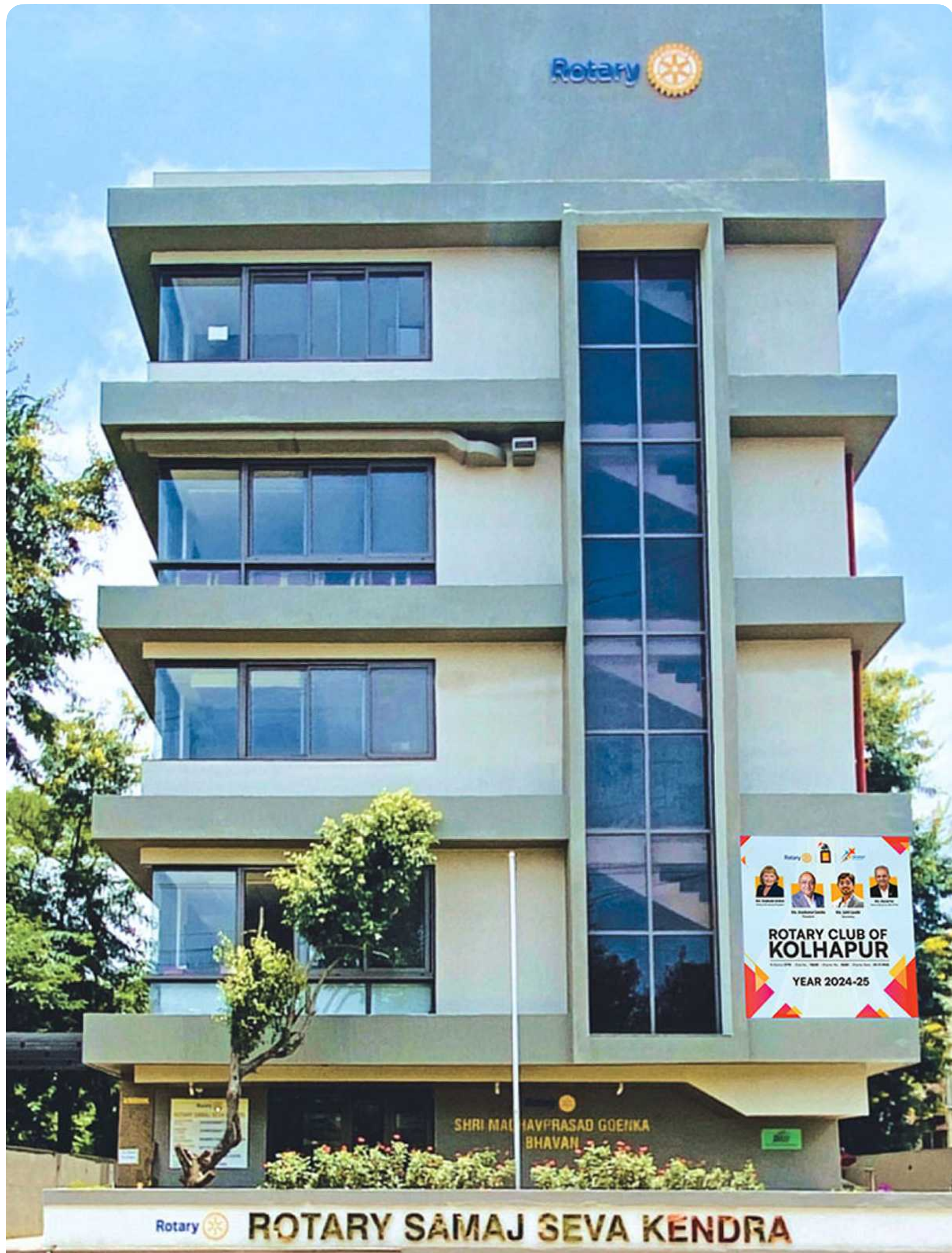
ROTARY CLUB OF KOLHAPUR'S ROTARY SAMAJ SEVA KENDRA BUILDING